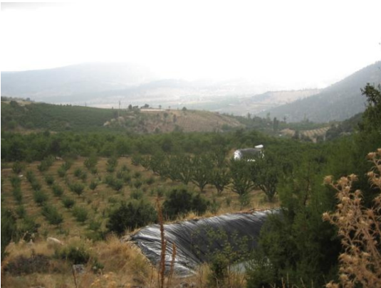
Mersin'de 1200 m yükseklikte Meyve Bahçeleri Tesisi (Proje Sahamız ile çok yakın benzerlik içermektedir.)