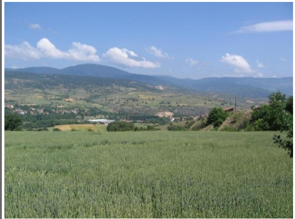
Ortaky'den Proje Sahası Grnm