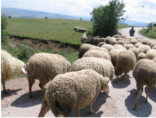
Proje Sahasında Hayvancılık Faaliyeti