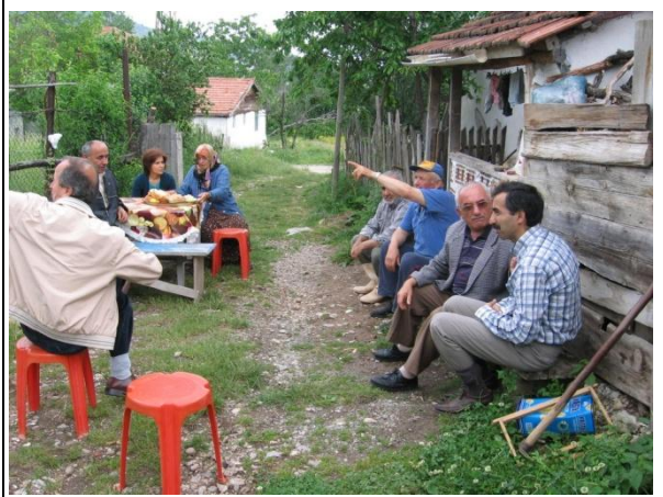
Göksu Çayı Mevkii-Şıhlar Köyünde Köylülerle Görüşme.