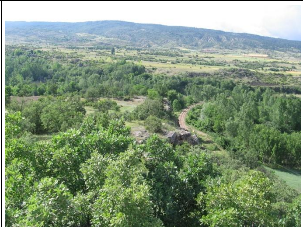
Proje Sahası Tarım Arazileri (Büyükyayalar-Budaklar Köylerinden Görünüm)