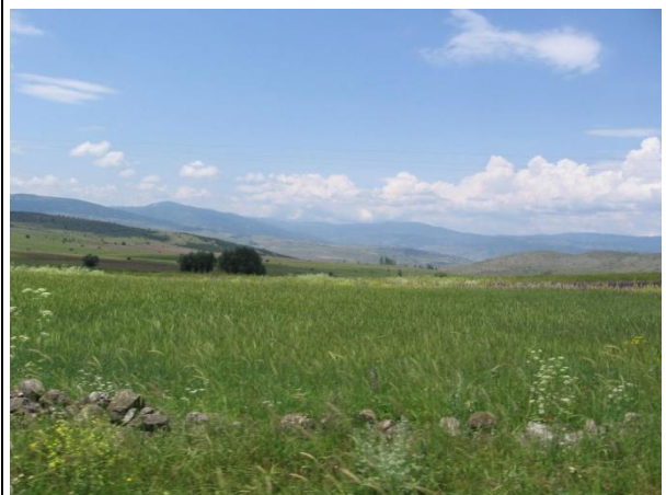
Sirt Havzasından Grnm