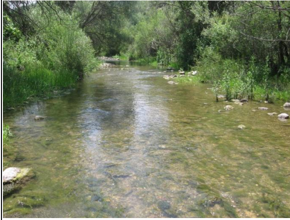
Deresamail-Asar ayı Grnm