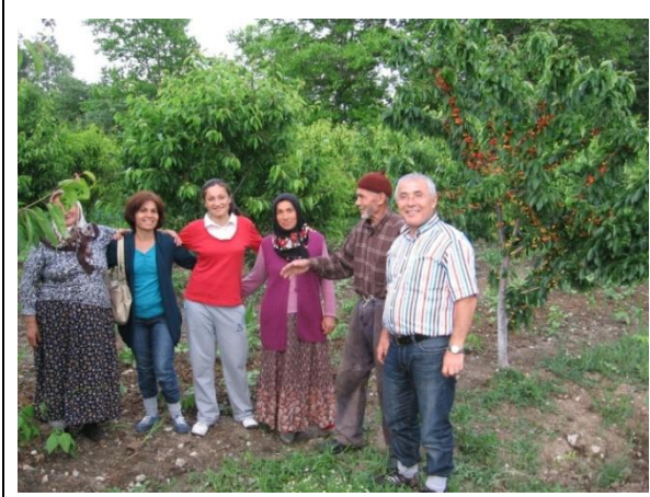
Ova Köyü Meyve Bahçesi Görünüm