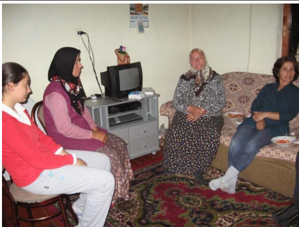
Ova Köyü Üreticilerle Görüşme