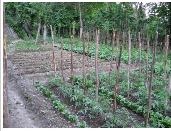
Ova Köyü Tarımsal Faaliyet Alanından Görünüm