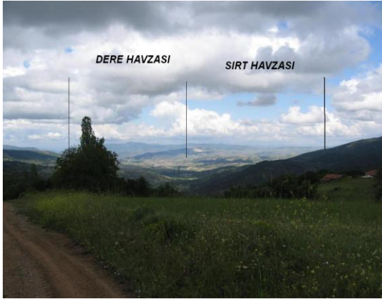
Kabaarmut Köyü Sırtlarından Sulama Havzası Genel Görünüm (Dere ve Sirt Havzaları)