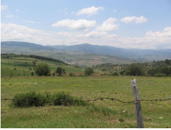
Sırt Havzası Yazıkavak Köyü Sırtlarından Görünüm