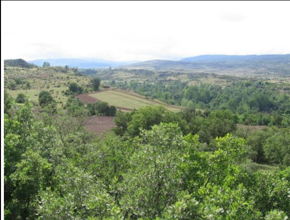
Proje Sahası Tarım Arazileri (Beytarla köyünden Proje Sahası Görünüm)