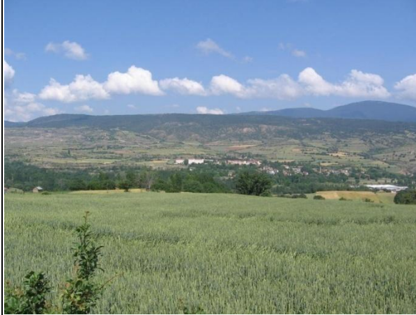
Ortaky'den Proje Sahası Grnm