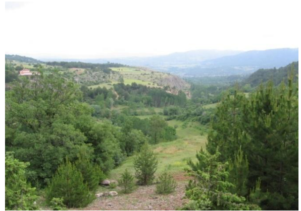
Göksu Mevkiinden Proje Alanı Görünüm (Dere Havzası)