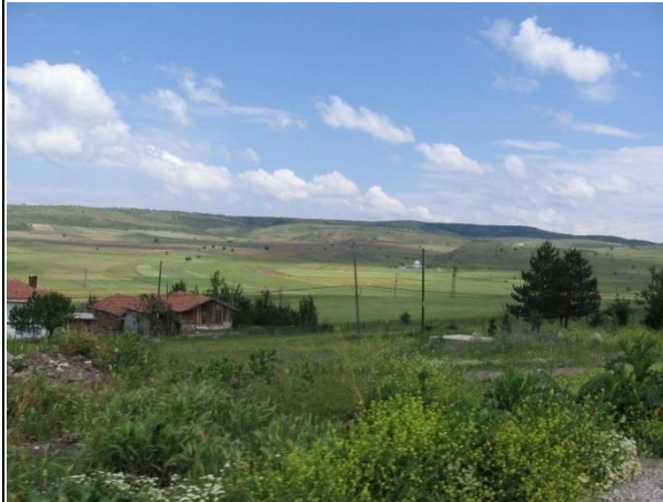
Sirt Havzası Hamamlı Ky Mevkiinden Grnm