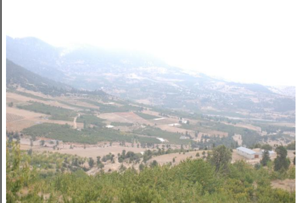
Mersin'de 1200 m yükseklikte Meyve Bahçeleri Tesisi (Proje Sahamız ile çok yakın benzerlik içermektedir.)