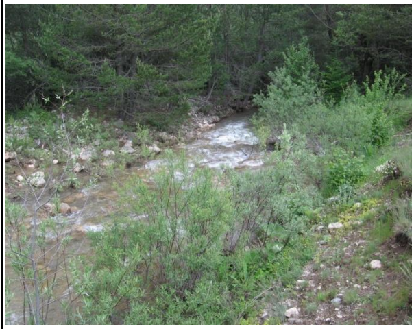
Eskipazar Çayı (Adıller-Kocaçay mevkii)