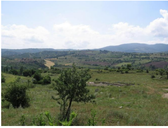
Proje Sahası Tarım Arazileri