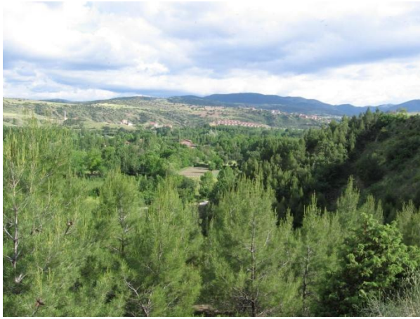
Haslı Köyü mevkiinden Eskipazar Merkez Görünüm