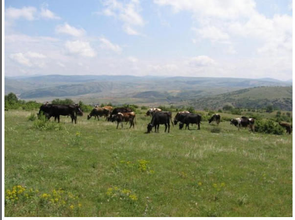
Sırt Havzası Genel Görünüm