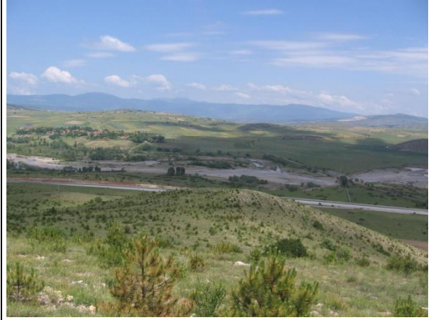
Sirt Havzası Bayındır Ky Mevkii-Soęanlı ayı