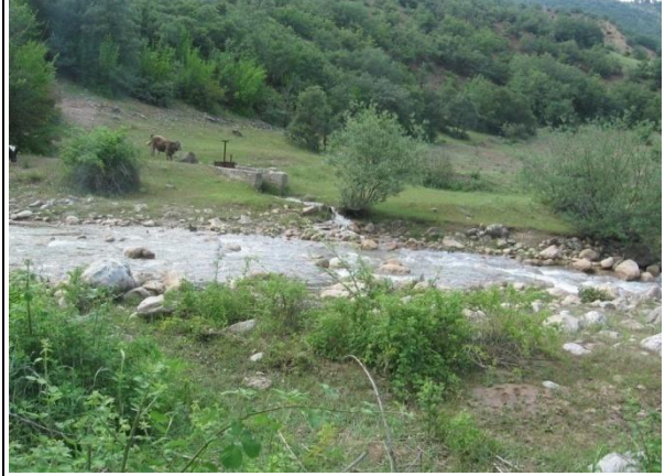
Hamzalar Köyü Mevkii Eskipazar Çayı