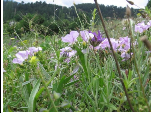
Şıhlar Köyü Doğal Floradan Görünüm