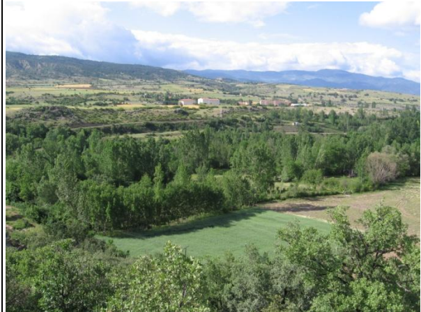
Proje Sahası Tarım Arazileri Kapucular Köyü-Eskipazar Merkez