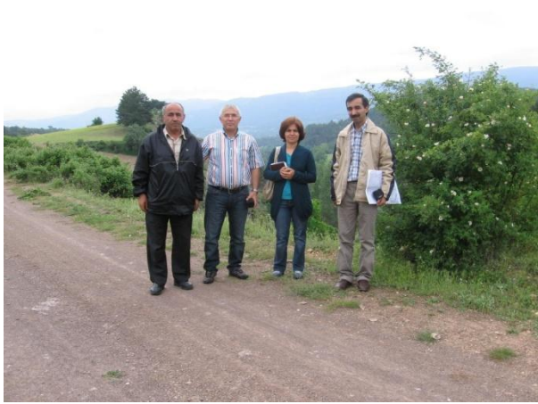
Göksu Çayı Mevkii İncelemeler